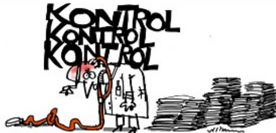
Tegning: Jørn Villemssen

Hver gang en patient træder ind, bliver vi på hospitalet druknet i en blanding af virtuelt og fysisk slavearbejde.